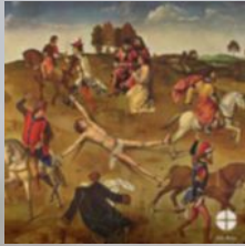
Saint Hippolytus 170 - 235 Feast Day - August 13

A theologian and martyr who died of ill-treatment in the quarries of Sardinia, Hippolytus was an important Christian in third-century Rome. In his writings, he attacked several popes for their doctrinal teaching and lax discipline. Followers set him up to rival Pope Callistus I, making him the first antipope. Banished to Sardinia during a Roman persecution, this cleric was there reconciled to the church and to another exile, Pope Pontian, with whom he shares this feast. He wrote in Greek and may have been from the East. His work “The Apostolic Tradition” preserved details about Christian life and customs in the early church. Visiting Rome around 212, Origen, a famous Christian teacher, and writer, went to hear Hippolytus preach.